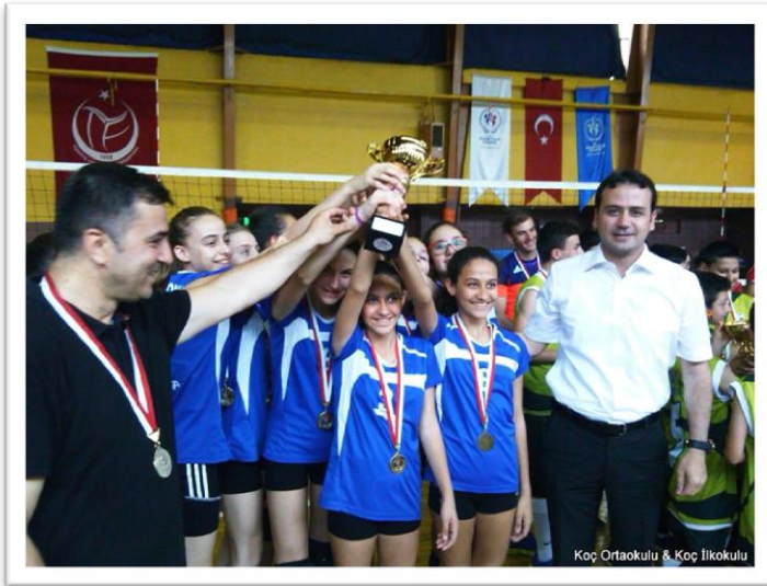
Resim 12: Şampiyonluk Kupası

Okulumuzun spor salonu oyun alanları ve konferans salonu etkin bir biçimde kullanılacaktır.