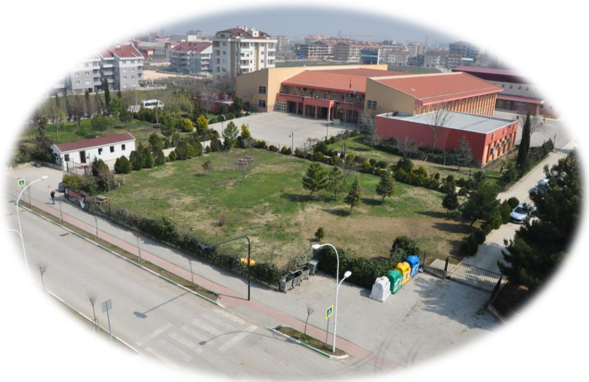
Resim 8: Koç Ortaokulu Genel Görünüm

Okulun alanı 18214 m 2 olup, 15739 m 2 si bahçe alanı olarak kullanılmaktadır. 1000 m spor salonu olarak kullanılmaktadır. Okul inşaatı taban alanı 2475 m 2 dir. Ağaçlandırma ve çiçeklendirme yapılmış olup, korunması sağlanmaktadır. Öğrencilerin oturmaları için kamelyalar yaptırılmış, banklar konulmuştur. Oyun alanları, spor alanları (basketbol, voleybol, futbol) hazırlanmıştır.