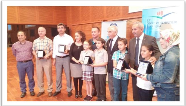
Resim 6: Ödül Töreni 2