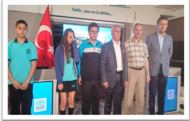
Resim 4: Nilüfer Belediyesi Ödül Töreni