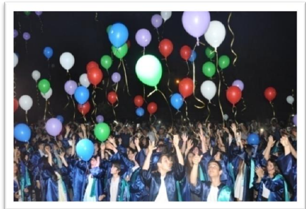
Resim 7: Sosyal, Kültürel Etkinlikler