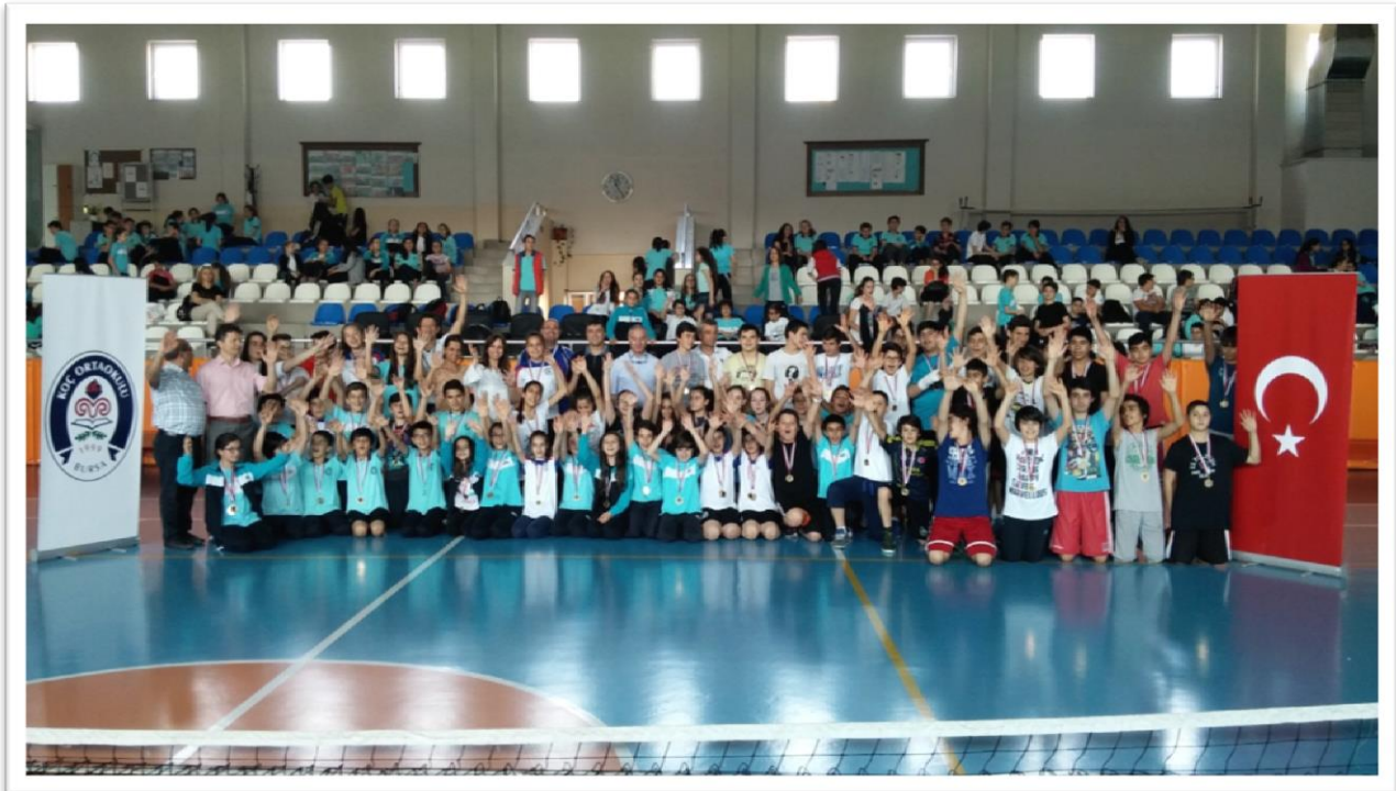
Resim 10: 4. Koç Spor Şenlikleri