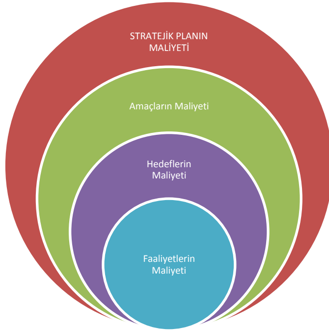
Şekil 2: Stratejik Plan Maliyetlendirme Şekli

Stratejik planların yıllık uygulama dilimlerini yıllık eylem planları oluşturur. Stratejik planlar ve bütçeler arasındaki ilişki yıllık eylem planları aracılığı ile daha ayrıntılı olarak kurulacaktır. Tahmini maliyetlerin belirlenen kaynak miktarını aşması durumunda düşük maliyetli faaliyetlerin seçilmesi, amaç ve hedeflerin zamanının değiştirilmesi ve farklı kaynakların bulunması gibi yöntemler kullanılarak gerekli güncellemeler yapılacaktır.