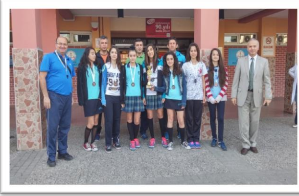
Resim 3: Ödül Töreni