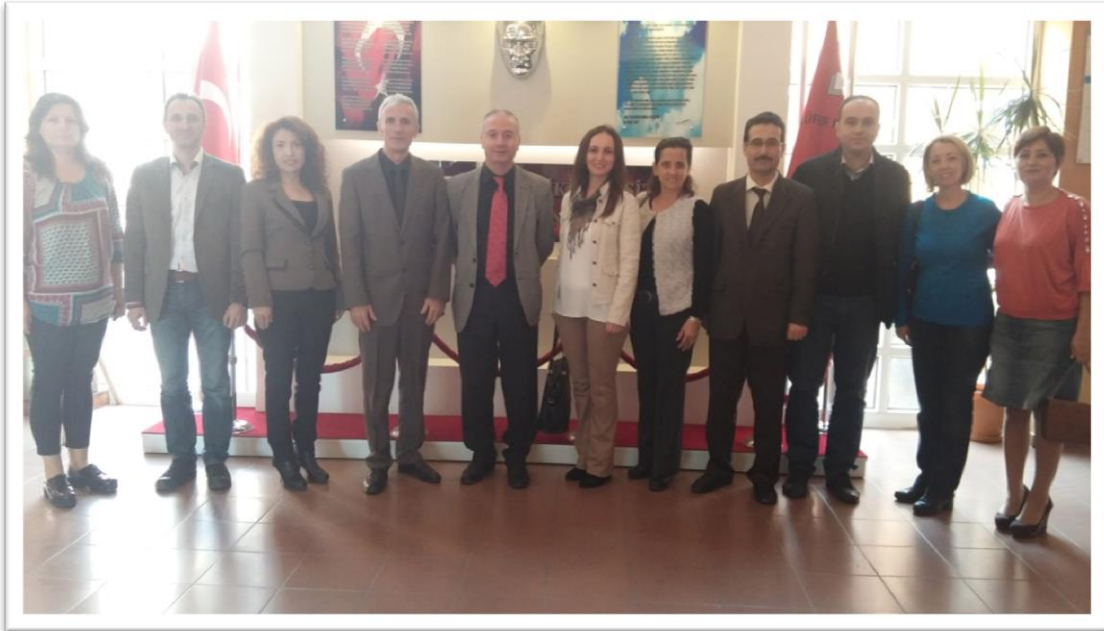
Resim 1: Stratejik Plan Ekibi