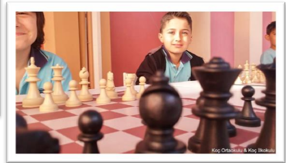
Resim 14: Kültürel Faaliyetler