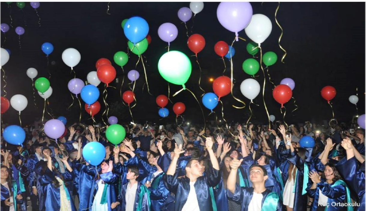
Resim 11: 2014-2015 Eğitim Öğretim Yılı mezuniyet Töreni

Uluslararası proje uygulaması teşvik edilerek, hareketlilik ve etkileşim artırılabilecektir.