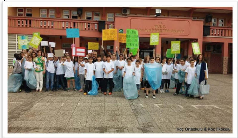
Resim 13: Toplum Hizmeti çalışmaları