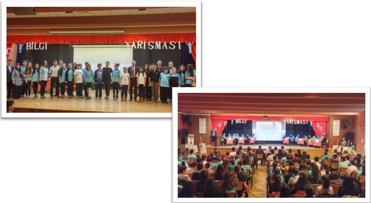
Resim 9: Koç Bilgi Yarışması

Böylece, dünyada kişiler arası ilişkilerde olduğu kadar, grup ve uluslararası ilişkilerde de sosyokültürel yönden hızlı değişimler meydana gelmektedir. Bilimsel, teknik ve düşünsel değişimler, eğitim ve öğretim alanındaki sistem ve yöntemleri de temelden değişime zorlamaktadır.