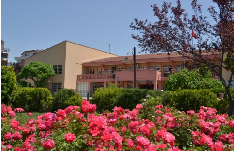
Resim 2: Koç Ortaokulu

anlamdaki destekleyicisi TOFAŞ A.Ş.'dir. TOFAŞ A.Ş. okulun sorunlarının çözümünde okula yardımcı olmaktadır.