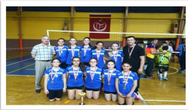
Resim 5: Voleybol Turnuvası Ödül Töreni